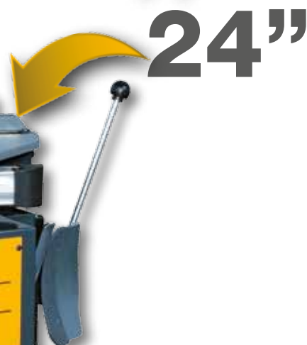
S43 GP con PT250 (a richiesta) - S43 GP with PT250 (optional) S43 GP mit PT250 (sonderzubehör)